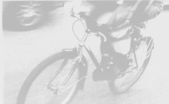
Les vélos étaient démontés et revendus en pièces détachées.

«Nous avons constaté une hausse des vols de vélos en série. Mais on ne s'est pas