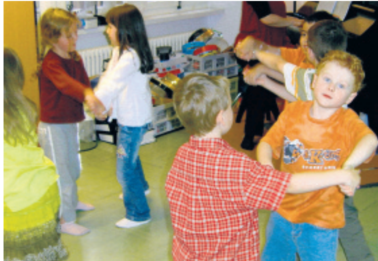
La musique étant un art de la communication et de l'expression, on lui donne toute sa vitalité en l'expérimentant dans un processus d'échanges.

conscience de l'autre sont des attitudes qui se travaillent très bien dès le plus jeune âge. Le travail d'écoutes diverses, de vitesses variées, d'énergies différentes, de perceptions d'une finesse est essentiel. La perception et l'adaptation sont des facultés auquel le jeune âge est habitué. Il peut les assimiler facilement, profondément et durablement.