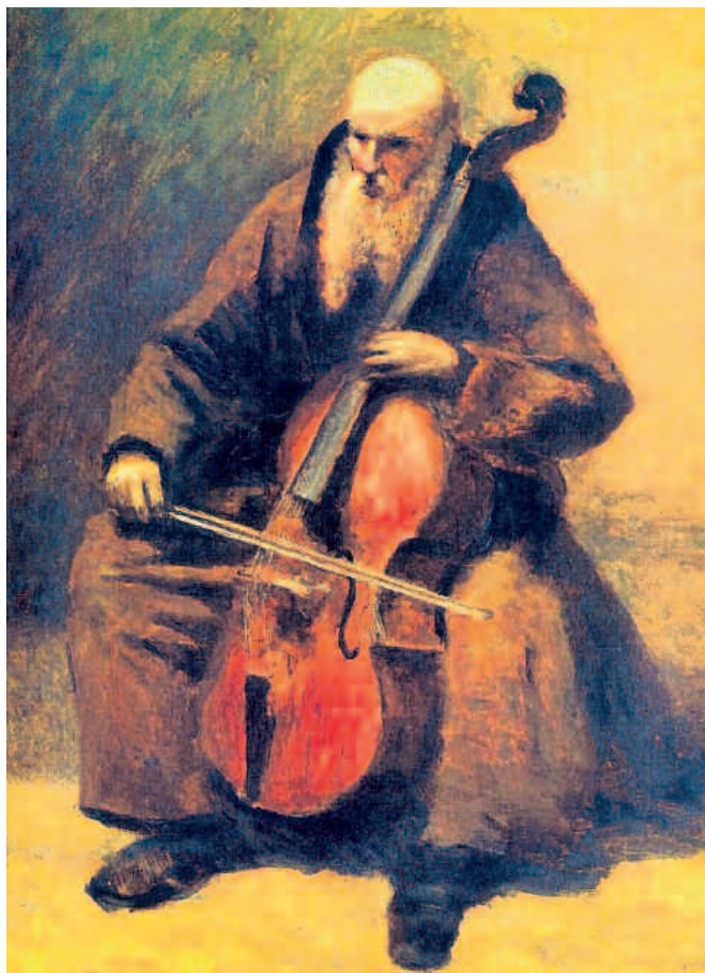
Jean-Baptiste Corot « Le moine au violoncelle », Hamburg Kunsthalle.

des moyens purement picturaux pour habiller ses impressions du matin sans peindre un coq » (Kandinsky).