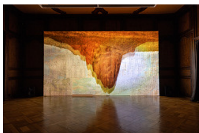
© THE UNDERWAYS I installation vidéo

Explorant les errances et les voies de traverse, cette installation met en lumière les méandres de la quête, les associations libres et les réflexions souterraines, les gestes et les territoires parcourus autant que le processus de fabrication. Mirage, trucage, solarisation, superposition et renversement des échelles en forment la trame de