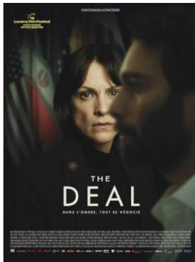
The Deal

manœuvrent en coulisse. L'arrivée inattendue de son ancien amour, Payam Sanjabi, un ingénieur iranien dont la vie est menacée, va lui compliquer dangereusement la tâche