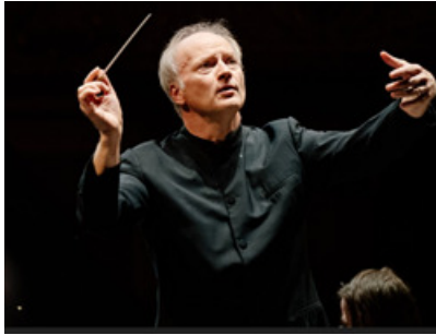
Gianandrea Nosedà

Spécialiste de la musique de Verdi, Gianandrea Nosedà dirige l'Orchestre et le Chœur de l'Opéra de Zurich, dont il est directeur musical depuis 2021, dans le flamboyant Requiem du compositeur.