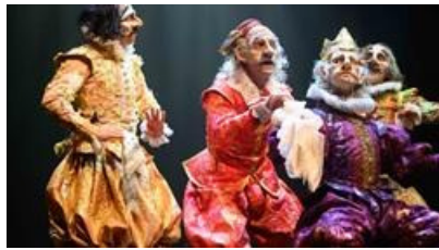
La Tempête

à émerveiller petits et grands. Omar Porras s'empare avec jubilation de cette pièce mythique, l'une des dernières de Shakespeare. Dans des décors et des costumes dignes de Miyazaki, il revisite les desseins de vengeance du mage Prospero et les célèbres amours de Miranda et Ferdinand. Si comme toute création