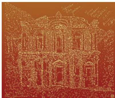
"Savoir pardonner... dans la simplicité" Poème calligramme © Nicole Coppey

Nicole Coppey , artiste suisse complète pluri-disciplinaire, musicienne, poétesse, calligrammiste, pédagogue artistique en musique, poésie, danses du monde et calligramme, étend ses multiples activités à la confluence des Arts.