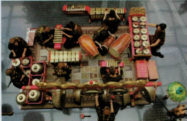
Kelompok gamelan 1-2-3-Musiques, terdiri dari musisi muda Swiss.