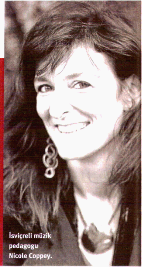
İsviçreli müzik pedagogu Nicole Coppey.

Ulvi Cemal Erkin'in "Beşli" ve "Dörtlü"sünün güzel yorumlarını koleksiyonunuzda bulundurmak istiyorsanız, Nicole Coppey'in kendi çocukları ve uluslararası müzisyenlerden oluşan bir topluluğa çaldığı "Erkin: Oda Müziği" albümünü edinmelisiniz.